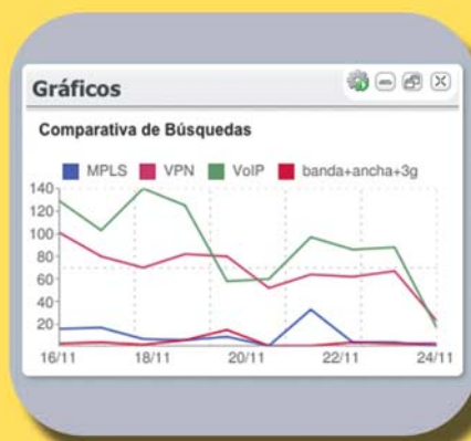
Gráfico de comparativa de búsquedas.